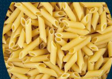
Penne Temos opção sem glúten!