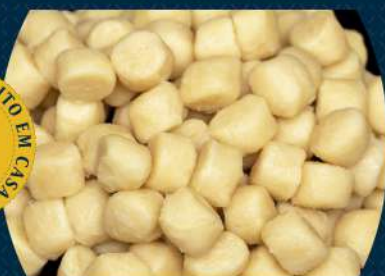
Gnocchi Temos opção vegana!