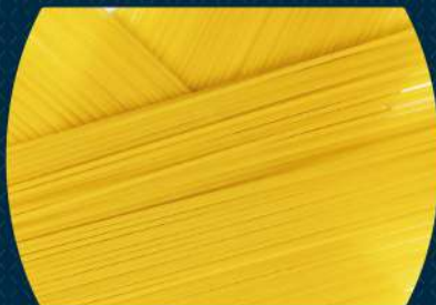
Spaghetti Temos opção sem glúten!